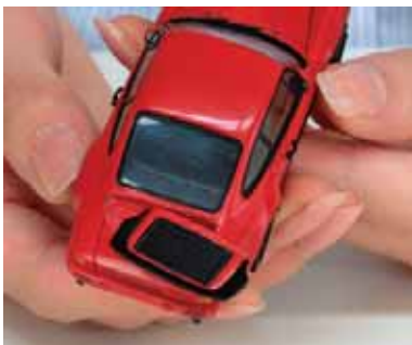
接着時間が長いので、貼った後でも位置合わせが可能。